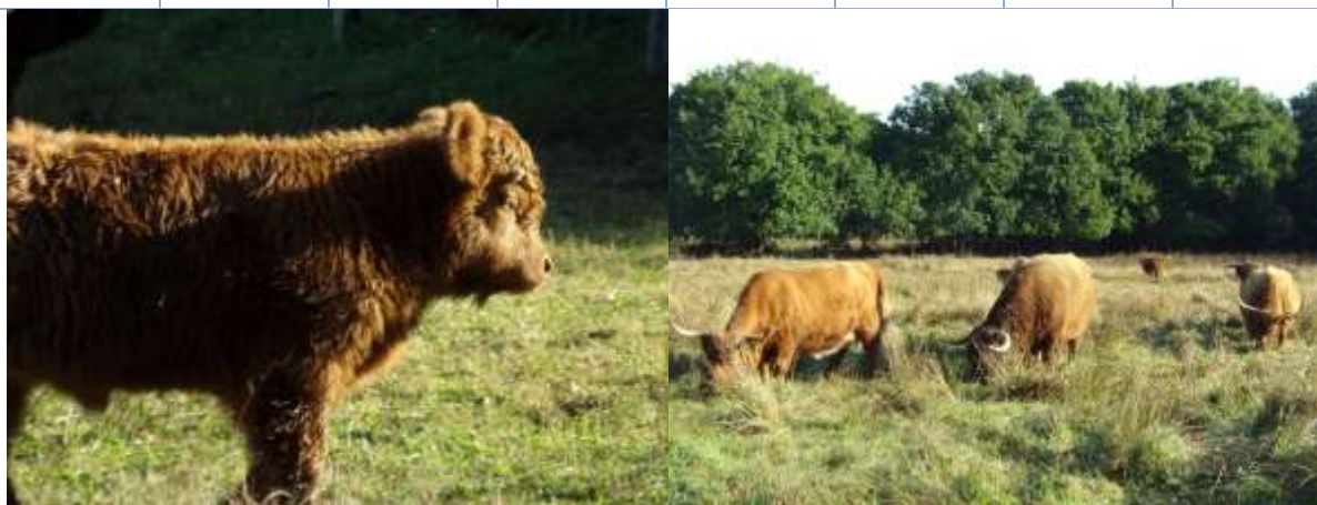
Le troupeau de vaches Highland Cattle en 2022

Le bilan du pâturage par les vaches est une nouvelles fois très positif pour la complémentarité qu'elles donnent par rapport au travail réalisé par les chevaux. Les végétations consommées ne sont pas les même et pas de la même manière. Leur présence est donc très appréciée.