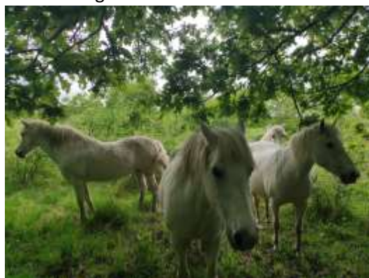
Mousse, Korse, Kellen et Lierre sont sur le site toute l'année

4 chevaux représentant chacun un chargement de 0.92 UGB soit 3.68 UGB pour le troupeau.